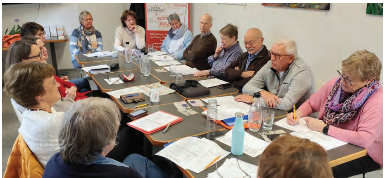
Meeting des Teams.

Fazit: Die Vermittlungsarbeit wurde erfolgreich fortgeführt und weiterentwickelt. Die Vermittlungszahlen, die engere Zusammenarbeit mit den Einsatzstellen und die stärkere Nutzung digitaler Informationskanäle zeigen, dass die Freiwilligenbörse bedarfsgerecht und verlässlich arbeitet.