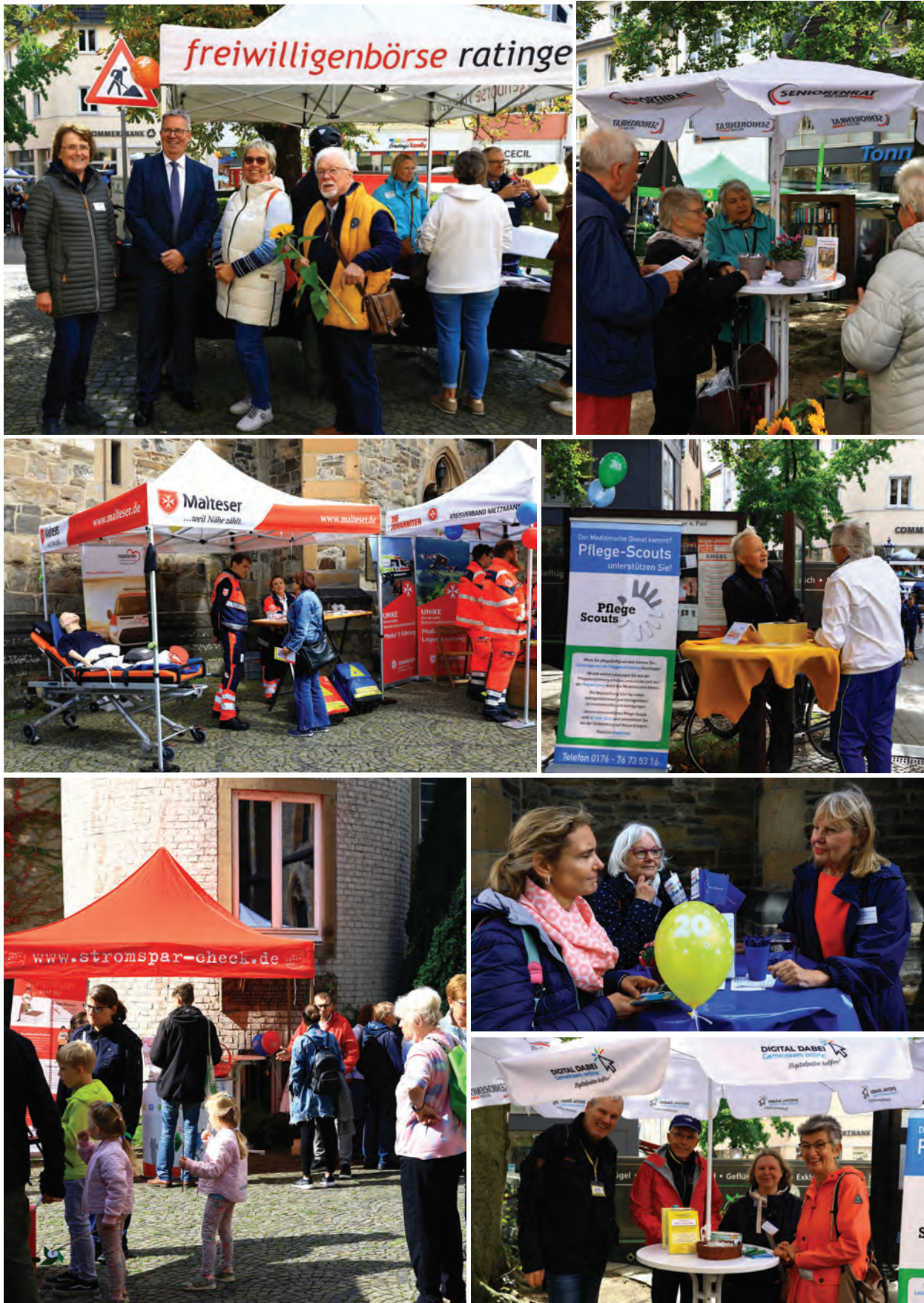
Impressionen von der Ehrenamtsmeile